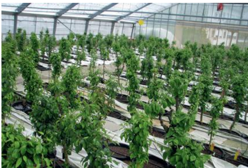
Nuklearstock in Wädenswil